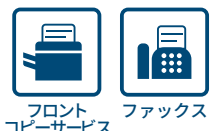
フロントコピーサービス