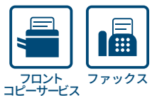
フロントコピーサービス